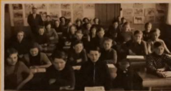
Klassebillede af 3. klasse (de store elever) 1951