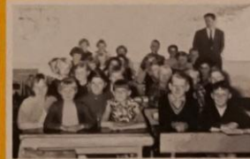
Klassebillede af 4. og 5. Årgang 1956