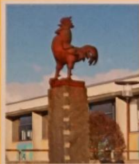
Erik Heides Hane på sokkel er Elsted skoles logo.