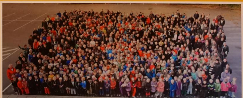
800 glade elever med deres 54 lærere, 3 børnehaveklasseledere og 30 skolepædagoger i efteråret 2012