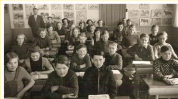
Klassebillede af 3. klasse (de store elever) 1951