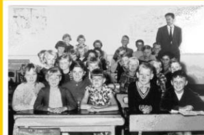
Klassebillede af 4. og 5. Årgang 1956