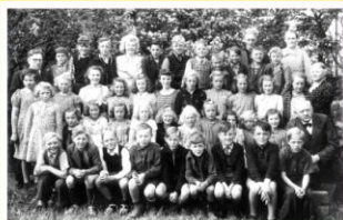
Skolebillede fra ca. 1942

Den seminarieuddannede lærer på den nye skole ved præstegården hed Christian Frederichsen. Til skolen hørte plads til 2 køer og 6 får, og lærerens løn bestod i stor udstrækning af naturalier. Skolen kunne derfor i 1860 sælges som landbrug og fik navnet Skovgaard. De fleste materialer til skolebyggeriet i 1816 blev leveret af ejeren på Skaarupgaard. De var fra en nedrevet lade. Skovgaards jorder blev senere udstykket til Elleparken, og gården brændte i 1967.